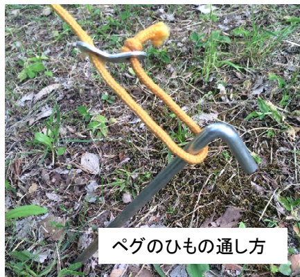
ペグのひもの通し方